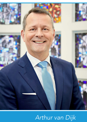
Arthur van Dijk

Van oudsher kent onze regio ondernemingszin en een economische dynamiek. Zaanstreek-Waterland is één van de eerste industriegebieden in Nederland, gekenmerkt door molens en werven en natuurlijk de handel. Onze stevige achtergrond biedt een mooie basis voor de toekomst. De provincie Noord-Holland is daarin uiteraard een belangrijke partner. Arthur van Dijk (VVD), op 3 februari 1963 geboren in Dordrecht, is sinds 7 januari 2019 commissaris van de Koning in Noord-Holland. Tijdens de Cornerbijeenkomst van 17 oktober vertelt hij u graag meer over de plannen van de provincie en gaat hij de dialoog met u aan.