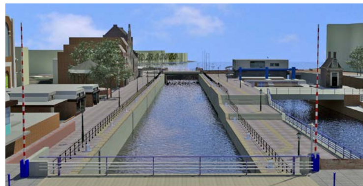
Sluiskolk impressie nieuwe situatie >